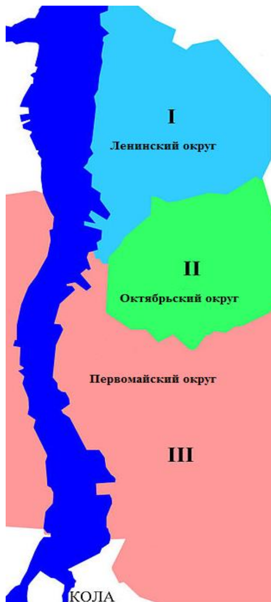
Рисунок 2.3 Существующее административное деление г. Мурманска

Административное деление г. Мурманска показано на рисунке 2.3.