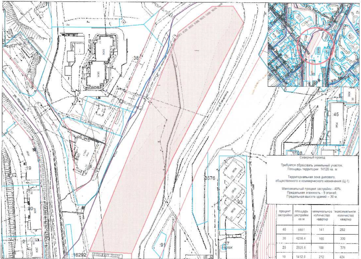
Схема расположения участка работ