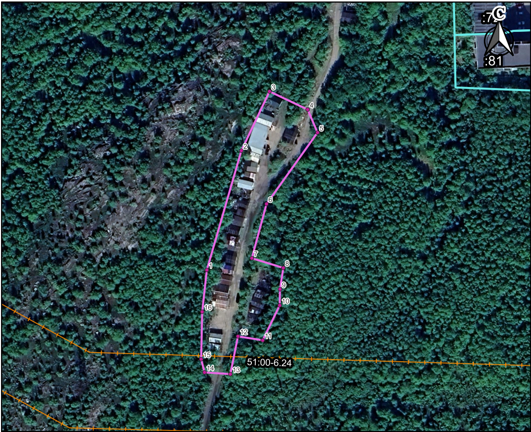
Ситуационный план М 1:10000