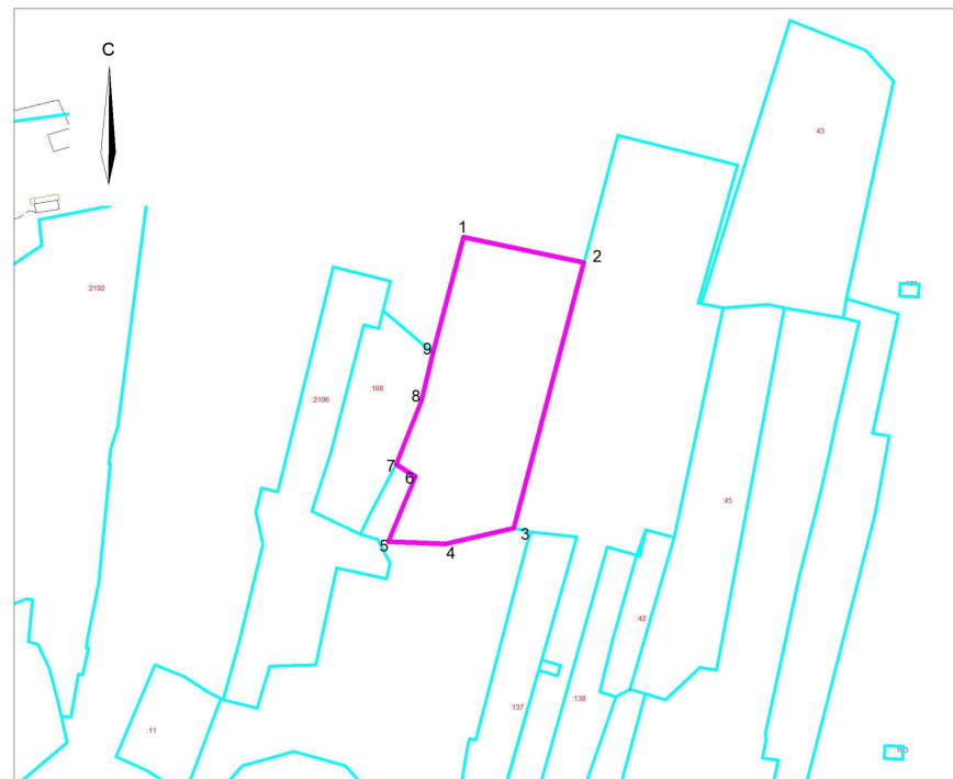
Ситуационный план М 1:10000