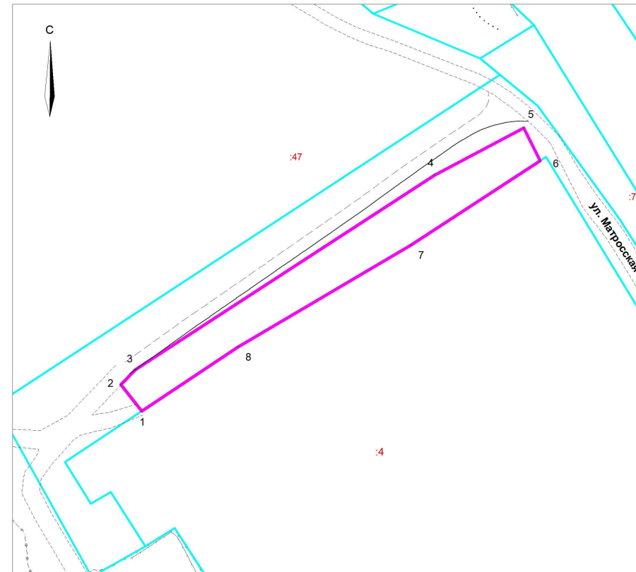
Ситуационный план М 1:10000