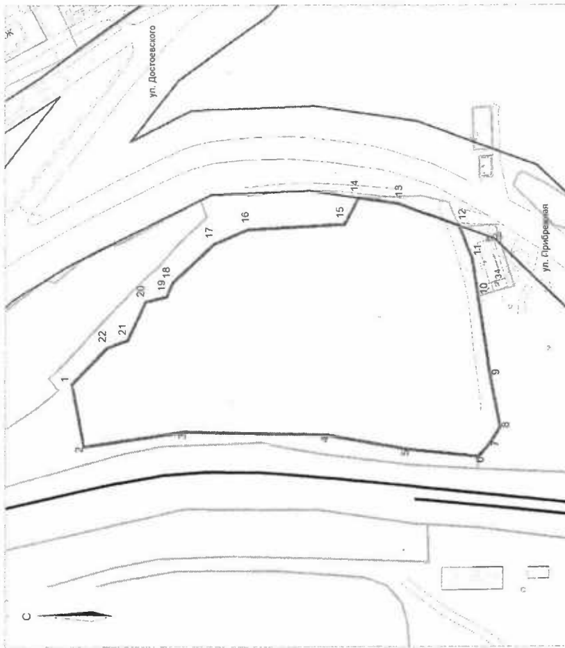
Схема размещения гаражей, являющихся недвижимыми сооружениями, либо для стоянки технических или других средств передвижения вблизи их места жительства на земельном участке с кадастровым номером 51:20:0001314:7 (масштаб 1:2000)