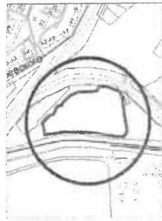
Ситуационный план М 1:10000