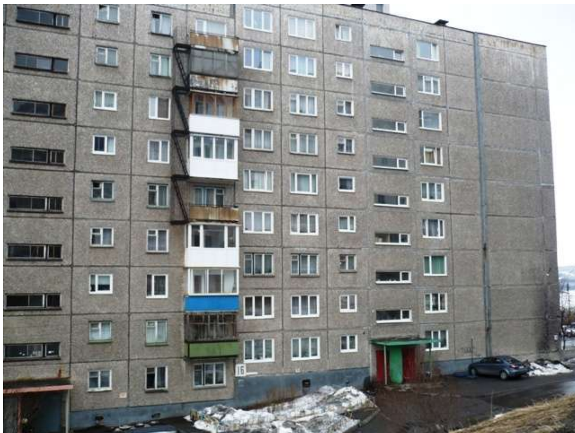
Достоевского, 16. Общий вид дома