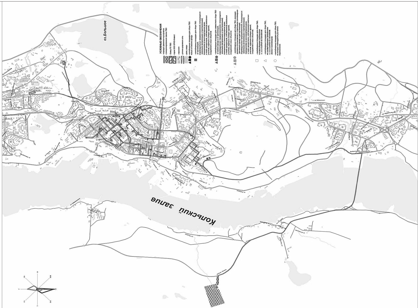
Масштаб 1 : 50 000