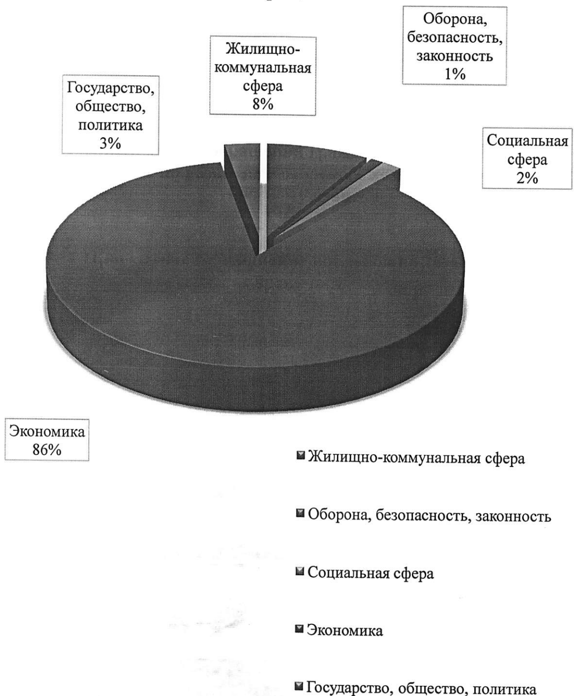
Процентное соотношение вопросов по тематике обращений