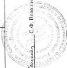
Рисунок 10.3. Паспорт качества топлива, используемого на котельных АО «МЭС»