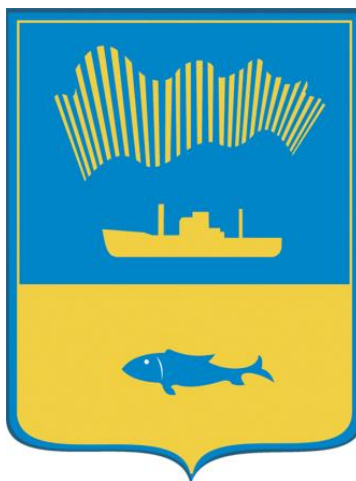
Схема теплоснабжения муниципального образования городской округ город-герой Мурманск на период с 2023 по 2042 годы Обосновывающие материалы