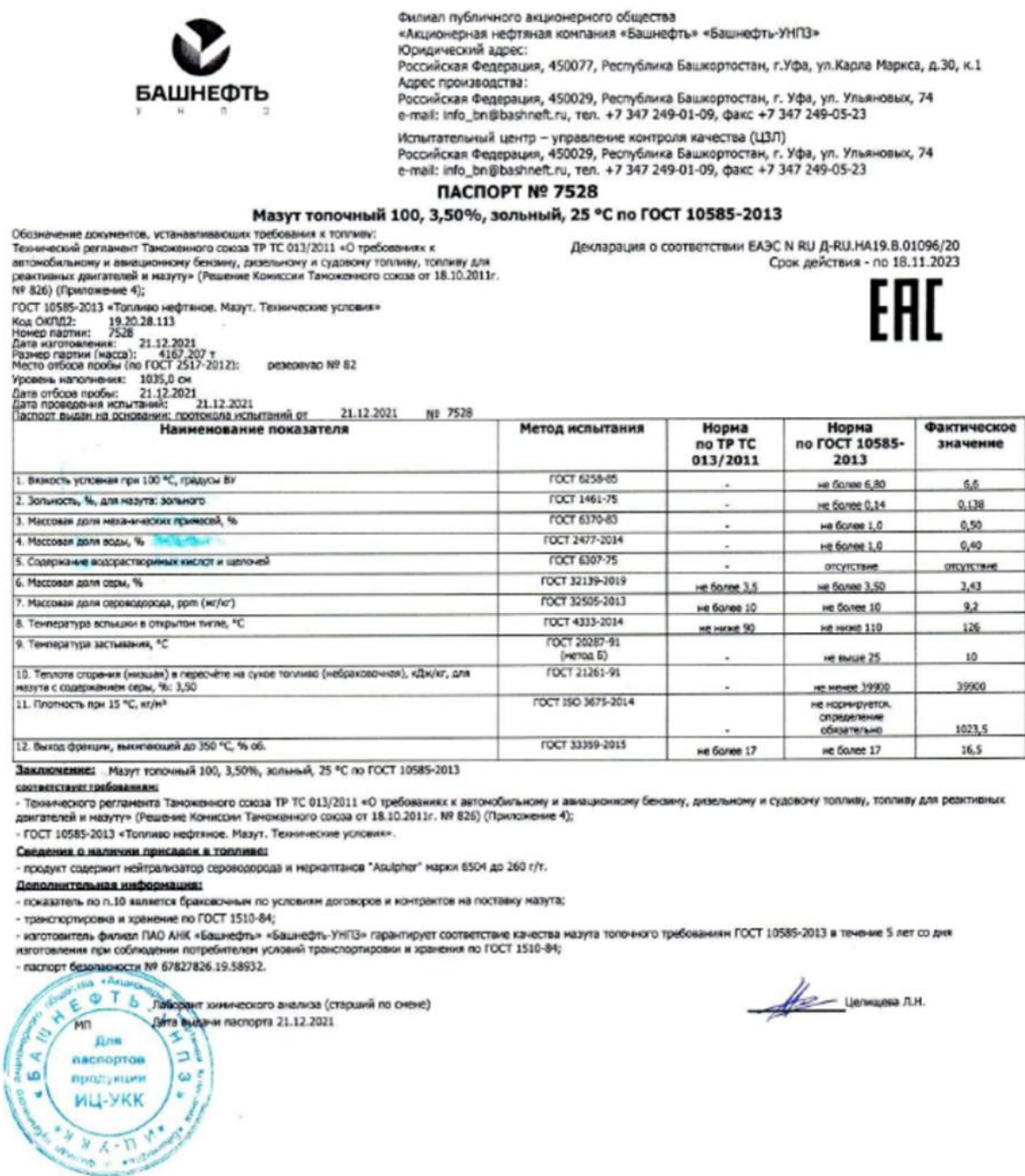
Рисунок 10.2. Паспорт качества топлива, используемого на источниках АО «Мурманская ТЭЦ»

Ниже представлены паспорта качества топлива, используемого на источниках АО «Мурманская ТЭЦ», АО «МЭС», АО «ММТП» и ЖКС №1 (г. Мурманск) филиала ФГБУ «ЦЖКУ» МО РФ ПО ОСК СФ.